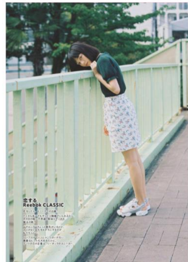
Brand Mook 『Reebok CLASSIC SHOULDER BAG BOOK』