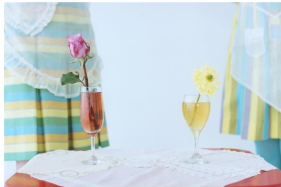
Personal Work - twins