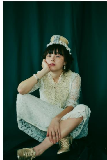
WEB magazine 『JADICT』